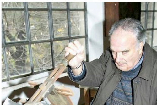
Una vecchia macchina per fare le buste

Taglio del nastro a Pietrabuona per il Museo della carta: l'appuntamento è per oggi dalle 9 alle 17. Una giornata intera dedicata al progetto «La via della carta in Toscana», grazie al quale è stato possibile restaurare un'ampia porzione della settecentesca Cartiera Le Carte di Pietrabuona (che sarà sede definitiva del Museo della carta), recuperare l'immenso patrimonio materiale e immateriale dedicato a uno dei mestieri che più di altri raccontano la storia, la stratificazione economica e lo sviluppo imprenditoriale del territorio, tra le province di Pistoia e Lucca, e ridare vita per una loro fruizione turistica ai vecchi percorsi di montagna, i «sentieri dai mastri cartai», che collegano i comuni di Villa Basilica e di Pescia. Una storia che non finisce e che il progetto «La via della carta in Toscana», ideato da Lucense e realizzato in collaborazione con il Comune di Villa Basilica e ed il Museo della Carta Ets-Onlus, grazie ai fondi di Ales SpA e al sostegno di Regione Toscana, Fondazione Cassa di Ri-