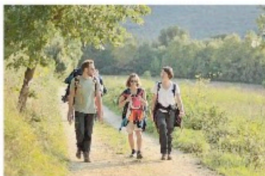
Alcuni degli autori in cammino sulla via Francigena

SAN GIMIGNANO. Un fine settimana dedicato al cinema indipendente: domani e domenica in Sala Tamagni torna "Altranzolazione", la rassegna che vuole raccontare l'Italia da un altro punto di vista, attraverso la lente del documentario d'autore. Un weekend dedicato al docu-film e all'incontro tra giovani autori e professionisti affermati: sarà questa, infatti, anche l'oc-