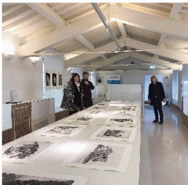
Una delle sale del nuovissimo Museo della carta a Pescia