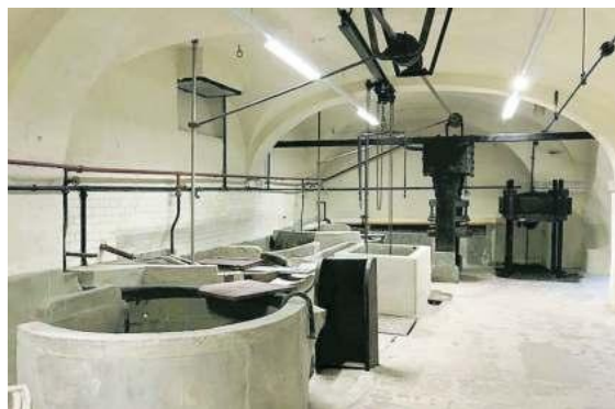
Il museo della carta di Pescia

PESCIA (LUCCA) – I sentieri sono tracciati e portano verso le case sparse, tra i boschi e le cartiere abbandonate nelle valli al confine tra le province di Lucca e di Pistoia. Quasi una cerniera fatta di strade lastricate che i mastri cartai, un tempo, percorrevano per raggiungere gli opifici e che adesso sono un parco di archeologia industriale che passa tra molini, ferriere e filande. La Via della carta in Toscana (2 milioni di euro di investimento) è un intreccio di itinerari culturali e turistici, una rete di una ventina di chilometri con percorsi che si diramano fra Villa Basilica e Pescia, cioè dal versante lucchese a quello pistoiense. Sono le “vie delle fabbrichine”, le mulattiere che percorrevano le donne che dalle valli andavano a lavorare nelle cartiere. La via (progetto Lucense, società pubblico privata lucchese che si occupa del rilancio del territorio, e realizzata con Comuni, Regione, fondi europei e fondazione Cassa di Risparmio di Pistoia, Pescia), ha l’obiettivo